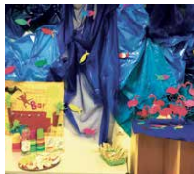
Aus großen Mülltüten entstand der Wasserfall.

Beim diesjährigen Spielefest konnten alle Kinder und deren Familien wieder die kompletten AG-Angebote und alle pädagogischen Fachkräfte kennenlernen. Die AG-Leiter zeigten ihre Angebote, Eltern und Kinder probierten sich bei einer Spiele-Rallye aus und kamen mit den Übungsleitern bei Kaffee und Kuchen ins Gespräch.