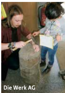
Die Werk AG

Diese Angebote sind freiwillig und die Kinder können sich ganz nach ihren persönlichen Vorlieben orientieren. Es