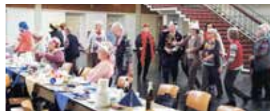
GE-Heßler: Kaum ein Jeck blieb hocken bei Polonaise & Co.

Aufwendige Kostüme, bunte Nachmittage mit spritzigen Büttenreden, gutem Essen und bester Stimmung: Stellvertretend für die vielen schönen Karnevalsfeiern drucken wir zwei Bilder aus den Ortsvereinen ab.