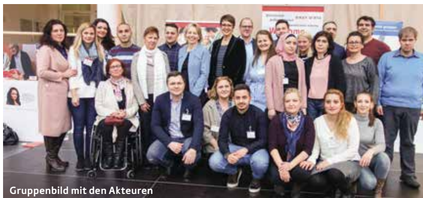
Gruppenbild mit den Akteuren